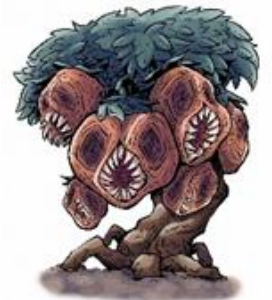
タンタンコロリン（宮城）