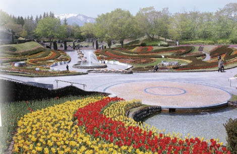
彩のひろば大花壇▶