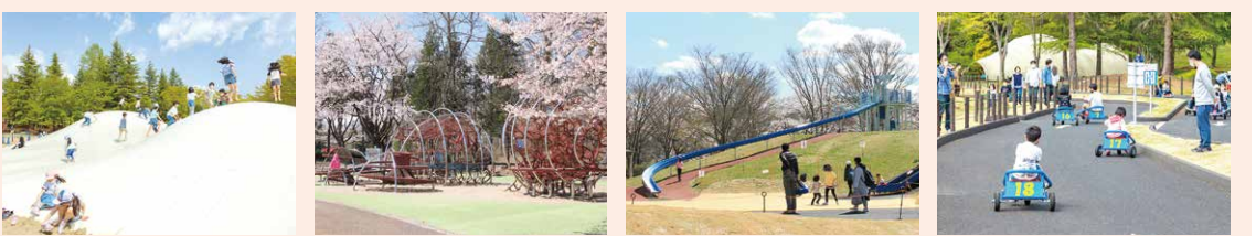
ジャンピングドーナツ | ジャイアント土偶 | ローラースライダー | 足こぎカート

子どもたちに人気の遊具が そろった「わらすこひろば」は、 みちのく公園の中でも一番 の人気スポット!たくさんある 遊具で、おもいっきり遊ぼう!