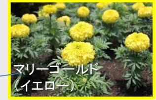
マリーゴールド (イエロー)