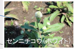
ゼンニチコウ(ホワイト)