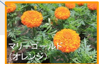
マリーゴールド (オレンジ)