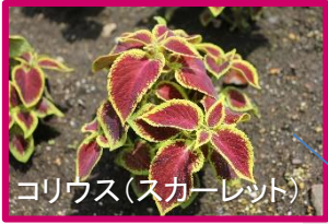
コリウス(スカーレット)