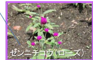
ゼンニチコウ(ローズ)