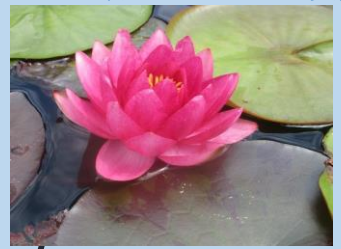
スイレン (6月上旬～9月上旬)