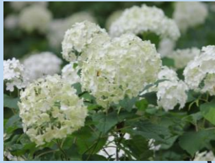
アジサイ (6月中旬～7月上旬)