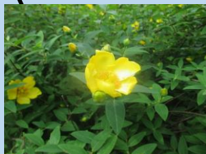
キンシバイ (6月中旬～7月頃)