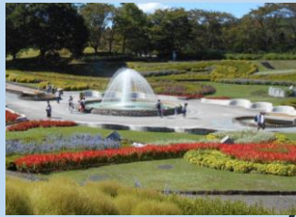
彩の大花壇 (マリーゴールド・サルビアなど) (6月中旬～10月下旬)