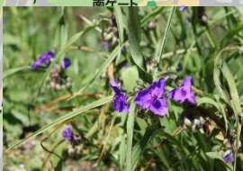
ムラサキヅクサ (5月中旬～6月下旬)