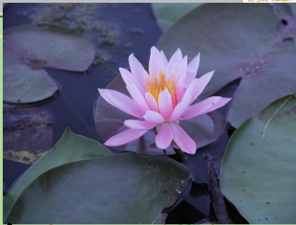
スズレン (白・ピンク) (6月上旬～10月頃)