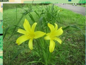
ヘメロカリス (6月上旬～8月頃)