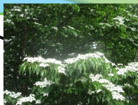
ヤマボウシ (5月下旬～6月下旬)