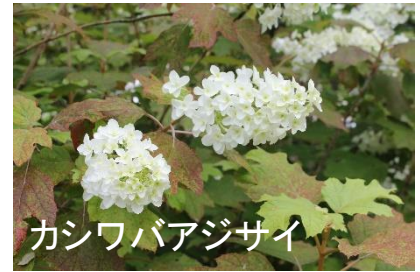
カシワバアジサイ