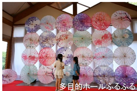
多目的ホールふるふる