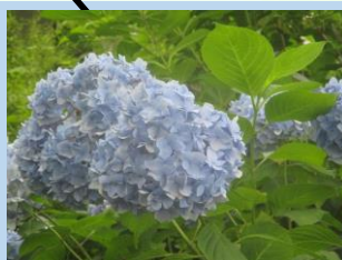
アジサイ (ヤマアジサイ・ガクアジサイ) (6月中旬～7月中旬)