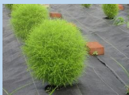
コキア (ミニサイズ) (6月下旬～10月中旬)