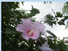
ムクゲ (6月下旬～9月頃)