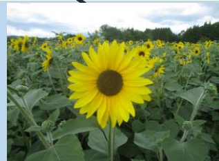
ヒマワリ (サンフィニティ) (7月中旬～8月中旬)