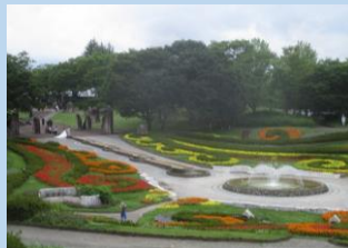
彩の大花壇 (6月中旬～10月中旬)