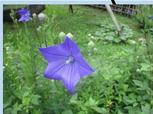
キキョウ (6月下旬～9月頃)