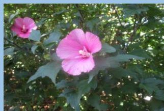
ムクゲ （6月下旬～9月頃）