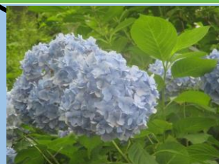
アジサイ （ヤマアジサイ・ガクアジサイ） （6月中旬～7月中旬）