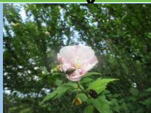
ムクゲ （6月下旬～9月頃）