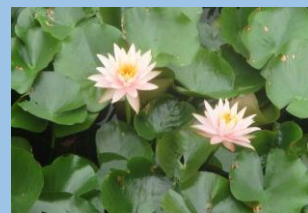
スイレン （6月上旬～9月上旬）