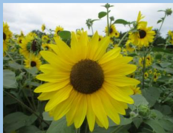
ヒマワリ （サンフィニティ） （7月中旬～8月中旬）