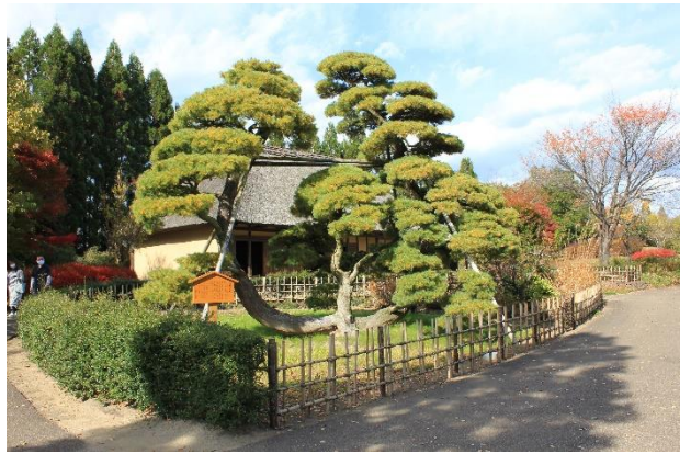
樹種: マツ科ゴヨウマツ 幹周: 右1.1m、中0.9m、左1.1m 樹高: 6.5m 推定樹齢: 600年 所在地: 南地区ふるさと村釜房の家 所有者: 国営みちのく杜の湖畔公園

昭和43年、釜房ダム建設時に湯田河温泉から国道286号沿いの高台に移植され、平成16年に国営みちのく杜の湖畔公園内に再移植されました。2度の移植に堪えたこの松は、蔵王系の霜降り五葉松の珍木で、湯田河温泉開湯(西暦1854年)より古く、伝承は600年以上といわれ、川崎町の指定文化財でもあり、そして、「川崎町の宝」となっています。