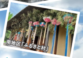
南地区「ふるさと村」