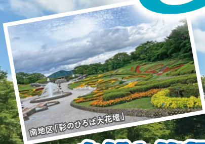
南地区「彩のひろば大花壇」