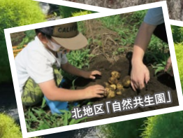
北地区「自然共生園」