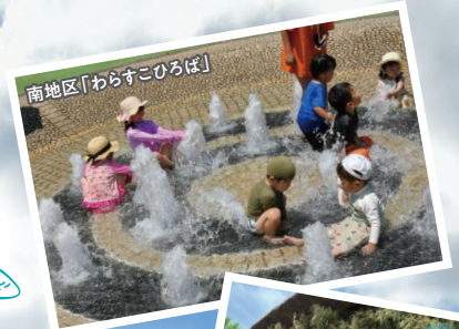
南地区「わらすこひろば」