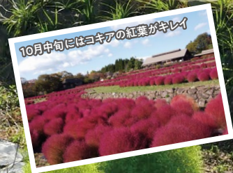
10月中旬にはコキアの紅葉がキレイ