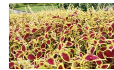
コリウス(2品種4色) 3,000株