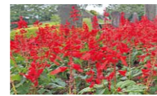
サルビア(2品種2色) 6,000株