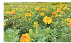
マリゴールド(1品種3色) 13,000株

花畑(20,000㎡)では蔵王連峰を背景にキバナコスモスが畑一面をレモンイエローに染めます。彩のひろば(7,000㎡)の大花壇をマリゴールド・サルビア・センニチコウなど約38,000株の花々がいろどりです。だんだん畑と大花壇の約7,000本のコキアはライム色から真っ赤に染まっていく様子がご覧いただけます。