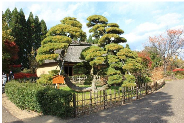
樹種: マツ科ゴヨウマツ 幹周: 右1.1m、中0.9m、左1.1m 樹高: 6.5m 推定樹齢: 600年 所在地: 南地区ふるさと村釜房の家 所有者: 国営みちのく杜の湖畔公園

昭和43年、釜房ダム建設時に湯田河温泉から国道286号沿いの高台に移植され、平成16年に国営みちのく杜の湖畔公園内に再移植されました。2度の移植に堪えたこの松は、蔵王系の霜降り五葉松の珍木で、湯田河温泉開湯(西暦1854年)より古く、伝承は600年以上といわれ、川崎町の指定文化財でもあり、“川崎町の宝”となっています。