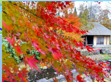
イロハモミジ (紅葉) (水車小屋周辺) ・～11月頃