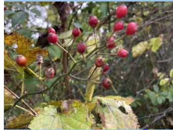
ノイバラ (湿性花園 ・～11月頃)