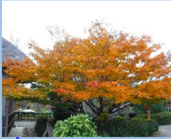
オオモミジ (長屋門よこ) ・～11月頃