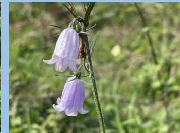
ツリガネニンジン (展望野草園 ・～11月頃)