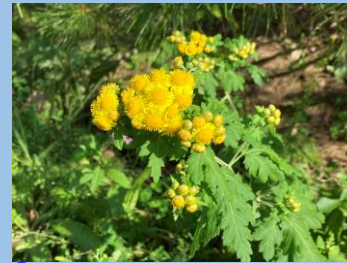
アワコガネギク (展望野草園 ・～11月頃)