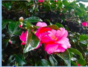
カンツバキ (大園路よこ) ・～2月頃