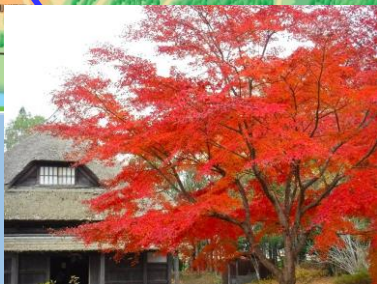
イロハモミジ (紅葉) (月山山麓の家) ・～11月頃