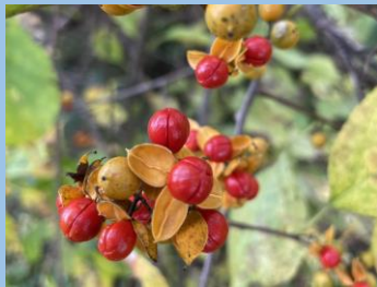
ツルウメモドキ (湿性花園 ・～12月頃)