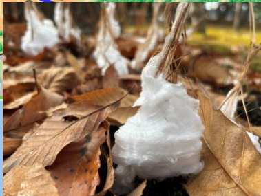
シモバシラ (氷柱) (南会津の家よこ ・～1月中旬頃)