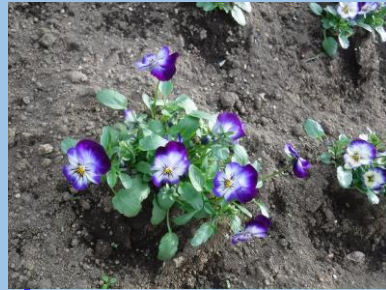
パンジー・ビオラ (彩の大花壇 ・～5月上旬)