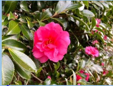
カンツバキ (大園路よこ ・～2月頃)