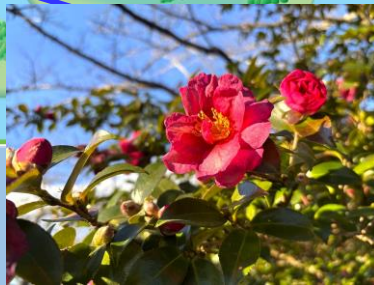
サザンカ (おまつりひろば横 ・～2月頃)