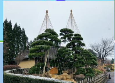
湯田河のまつ (雪吊り) (釜房の家 ・～3月頃)