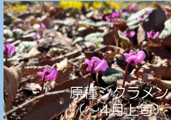
原種シクラメン (～4月上旬頃)