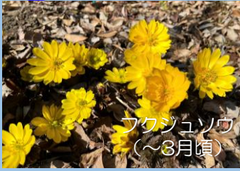
フクジュソウ (～3月頃)