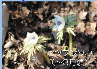
セツランソウ (～3月頃)