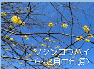
ソシンロウバイ (～3月中旬頃)