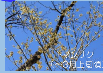
マンサク (～3月上旬頃)