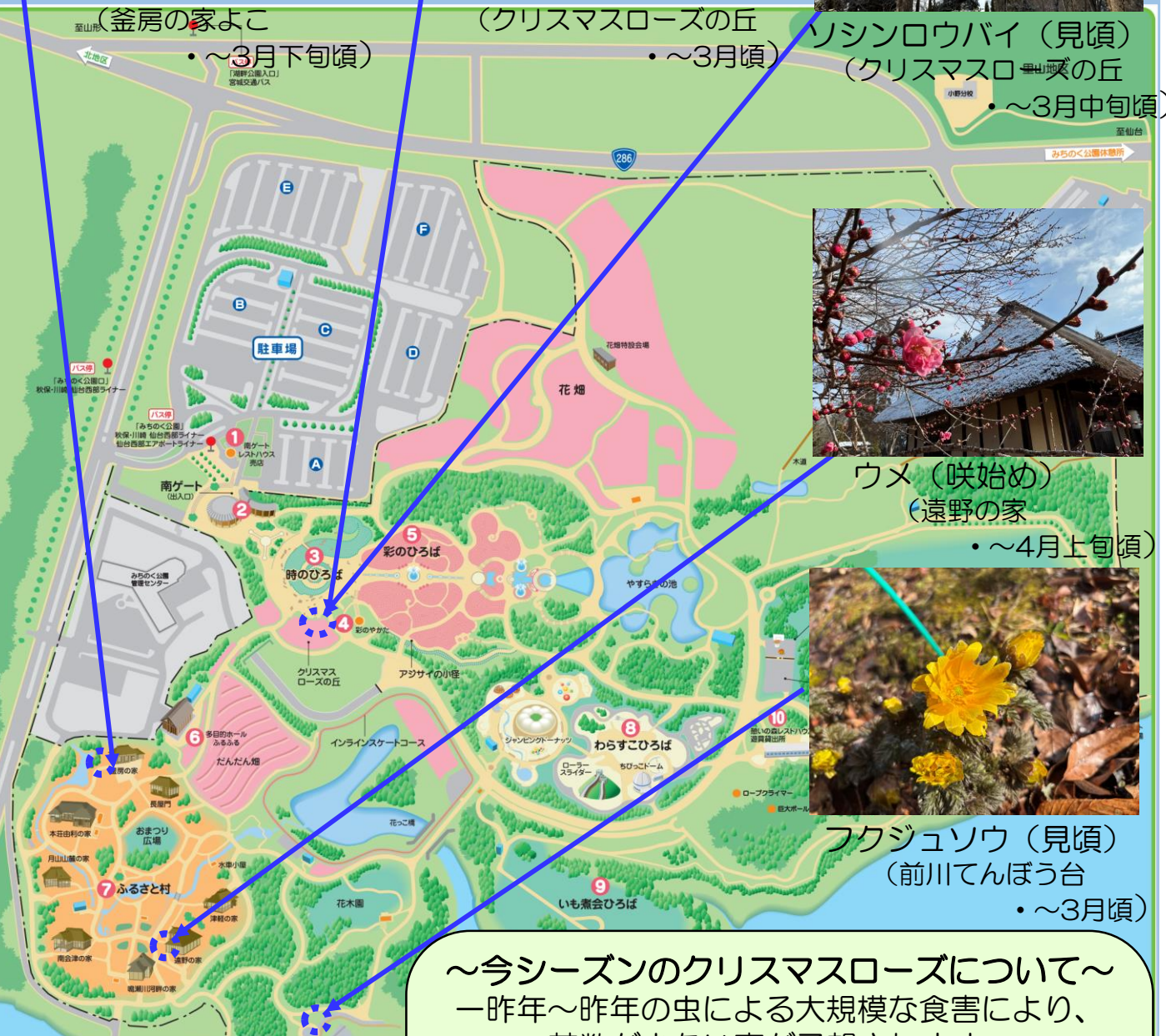
ソシンロウバイ (見頃) (クリスマスローズの丘 ～3月中旬頃)