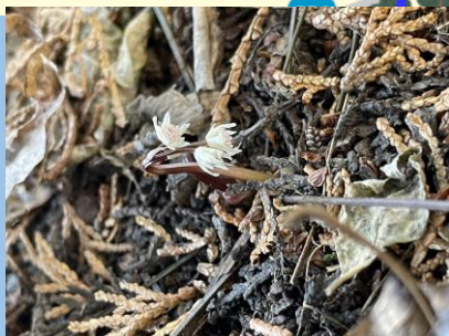
セリバオウレン (咲始め) (いぐね近くの林内・～4月頃)