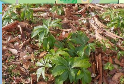
現在の クリスマスローズの様子

～今シーズンのクリスマスローズについて～ —昨年～昨年の虫による大規模な食害により、 花数が少ない事が予想されます。 (葉は出ていますが、花をつけるのは来シーズン以降の株が多いと想定しています。) 楽しみにお待ちしておりますお客様には大変申し訳ございません。 引き続き食害への対策を行って参りますので、 ご理解のほどよろしくお願いいたします。