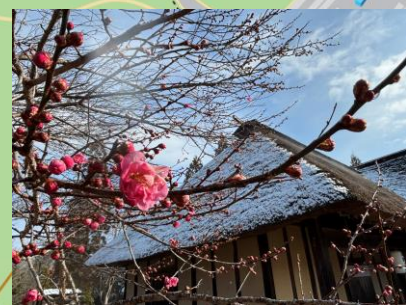
ウメ (咲始め) (遠野の家 ～4月上旬頃)