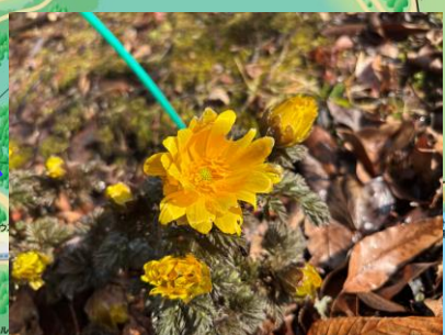
フクジュソウ (見頃) (前川てんぼう台 ～3月頃)