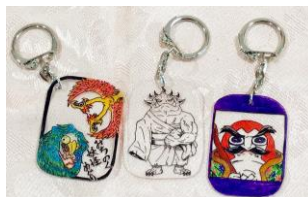
妖怪プラ板キーホルダー