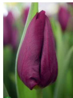
パープルアイ 紫・一重咲き トライアンフ