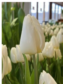
ホワイトマーベル 白・一重咲き シングルアーリー