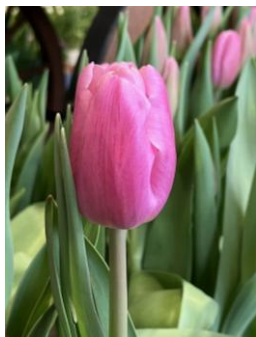
ジャンボピンク ピンク・一重咲き トライアンフ