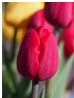
インベダー 赤・一重咲き トライアンフ