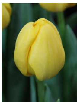
ノビサン 黄色・一重咲き ダーウィン・ハイブリッド